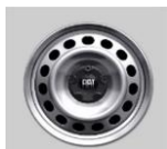
15"-os acél keréktárcsa