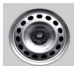
16"-os acél keréktárcsa