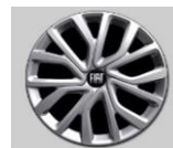
16"-os teljes díztárcsa