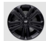
16"-os fekete könnyűfém felni